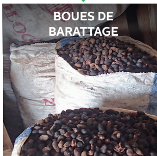
BOUES DE BARATTAGE