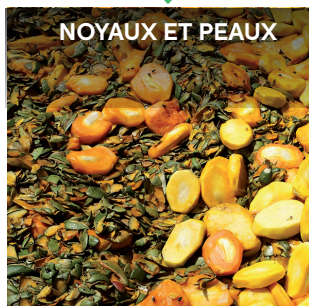
NOYAUX ET PEAUX