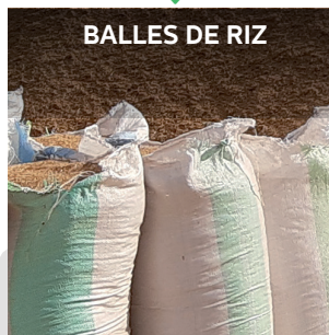
BALLES DE RIZ